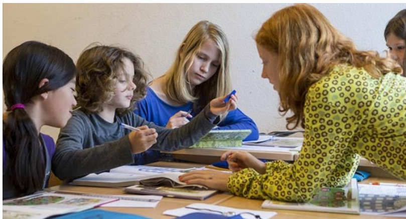
Samen schrijf-ideeën opdoen!

Wie graag een artikel wil ontvangen zal dit met genoeg worden toegestuurd. Op de website van het Platform Handschriftontwikkeling ( www.handschriftontwikkeling.nl ) is, per bundel, een overzicht van alle artikelen te vinden en wel via de sitemap