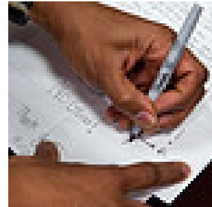
President Barack Obama

Zie vooral www.linkshandigendag.nl en www.linkshandig.info .