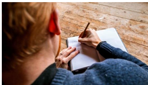
Schrijven schoolt de fijne motoriek en vraagt het hele brein