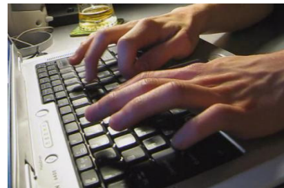
Typen met tien vingers